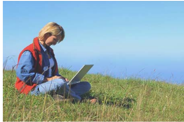
Alfresco, un nuevo enfoque

Alfresco permite a los usuarios tener acceso a un sencillo Sistema Virtual de Archivos Inteligente desde una aplicación nativa o portal con el poder de un Sistema de Gestión de Contenido Corporativo.